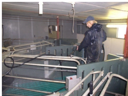
Oczekiwane standardy czyszczenia